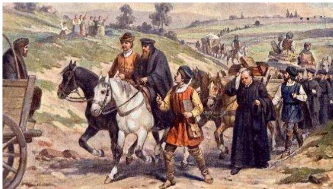
Komenský odchází do Lešna

Komenského jsme v našem seriálu opustili v době, kdy prožíval nejšťastnější léta svého života. Plodně tvořil svá díla, zkoušel své pedagogické metody, byl čerstvým manželem a otcem. V Evropě tou dobou však takováto idylka zdaleka nepanovala, vrcholících náboženských sporů mezi katolíky a protestanty se totiž rozhodli využít panovníci jednotlivých zemí pro rozšíření své moci. V českých zemích byla v době Komenského příchodu do Fulneku velice komplikovaná situace, nebylo totiž jasné, kdo nahradí dosluhujícího krále Matyáše. České stavy nakonec přijaly na zemském sněmu Ferdinanda II., který ač zarytý katolík, slíbil, že pokud se stane českým